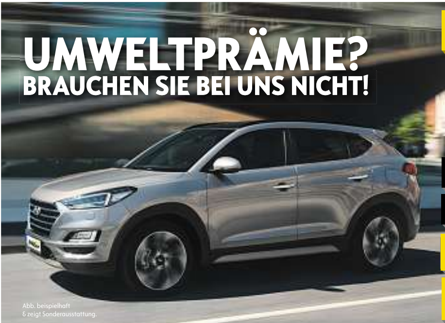
Abb. beispielhaft & zeigt Sonderausstattung.