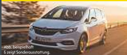
Abb. beispielhaft & zeigt Sonderausstattung.

Benzin, 125KW (170 PS), Schaltgetriebe, Frontantrieb