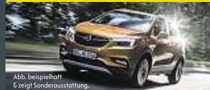
Abb. beispielhaft & zeigt Sonderausstattung.

Benzin, 103 KW (140PS), Schaltgetriebe, Frontantrieb