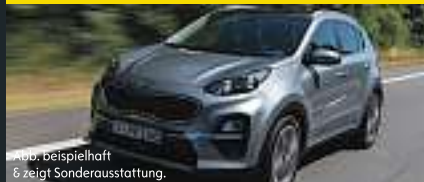
Abb. beispielhaft & zeigt Sonderausstattung.

Benzin, 130KW (177 PS), Schaltgetriebe, Frontantrieb