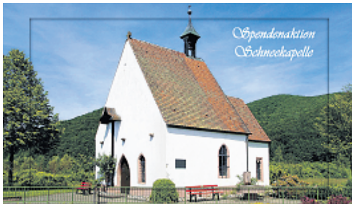
Aktueller Spendenstand zur Sanierung der Schneekapelle

Montag, 8. Juli 2013, 19:00 Uhr Klima(schutz)/Energiewende Ökologie/ Naturschutz/ Bevölkerungsschutz