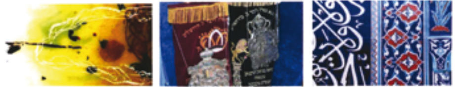
Evangelische Kirchengemeinde Haslach