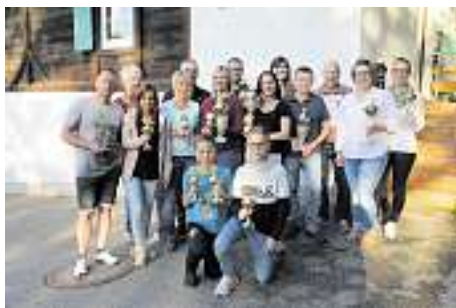
Wer siegt im Jahr 2022? Das Bild zeigt die besten Schützen/innen aus dem Jahr 2018.

1) 10 bis 13-jährige Schützen/innen nur in Begleitung der Erziehungsberechtigten