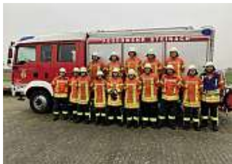
Gruppe um Herde Felix