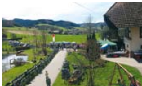
Auf Ihr Kommen freut sich Ihre Musikkapelle Welschensteinach

einer Radtour in schöner Lage die Grill-saison zu eröffnen und weiterzuführen. Weiter können Sie sich auf unsere Kaf-fee- und Kuchentheke freuen, wo viele, verschiedene, leckere und selbstgema-chte Kuchen für Sie bereitstehen. Für Un-terhaltung sorgt zum Frühschoppen und Mittagstisch ab ca. 11.30 Uhr das Jugend-orchester der Musikkapelle Welschen-steinach. Am Nachmittag unterhält Sie die Gesamtkapelle. Bitte beachten Sie, dass es am Festgelände nur eingeschränk-te Parkmöglichkeiten für Autos gibt. Da sich das Frühlingsfest unter freiem Him-mel abspielt, müssten wir bei Regenwet-ter das Fest kurzfristig absagen und auf einen anderen Termin verschieben.